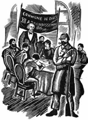
La Commune 1871