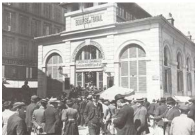
La Bourse du travail