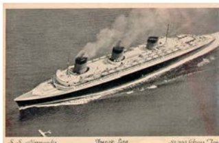
SS Normandie 1935-1942