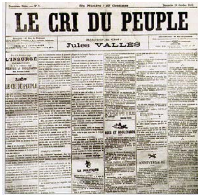
28 octobre 1883