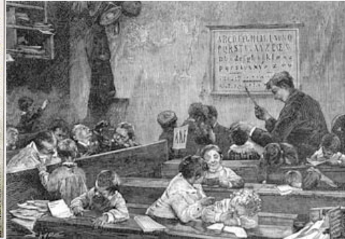
Les lois scolaires 1881-1882