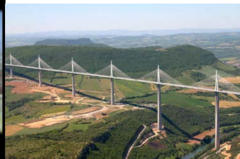
Le viaduc de Millau 2005