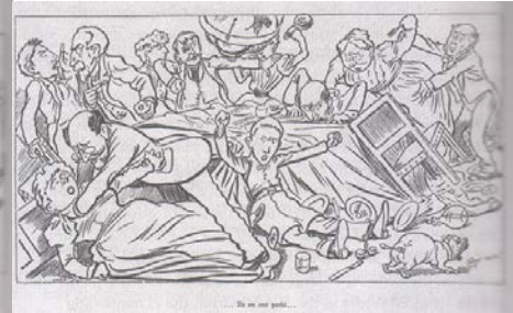
Ils ont parlé de l'Affaire Dreyfus