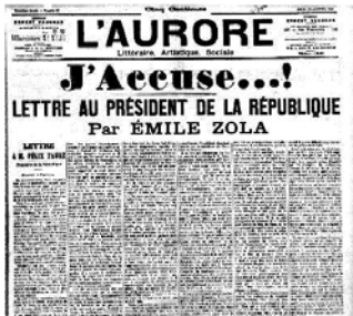
13 janvier 1898