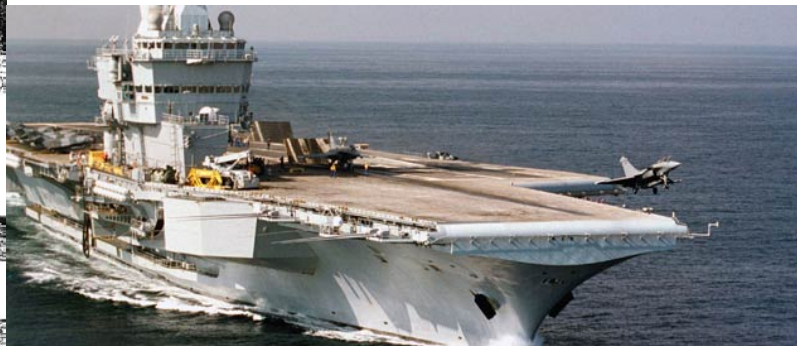
Le porte-avions nucléaire « Charles de Gaulle »