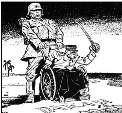
Pétain au service de l'Allemagne