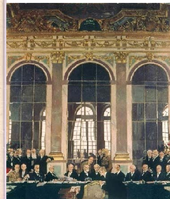
Le traité de Versailles