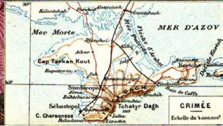
Guerre de Crimée